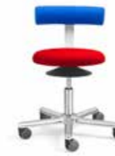
AOGO EG 4-5 E