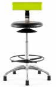
AOGO EG 6-5 XL A