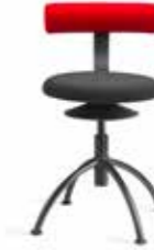
AOGO EG 4-5 V