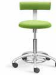
AOGO EG 4-5 A + 1F1