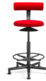
AOGO EG 6-5 XL E