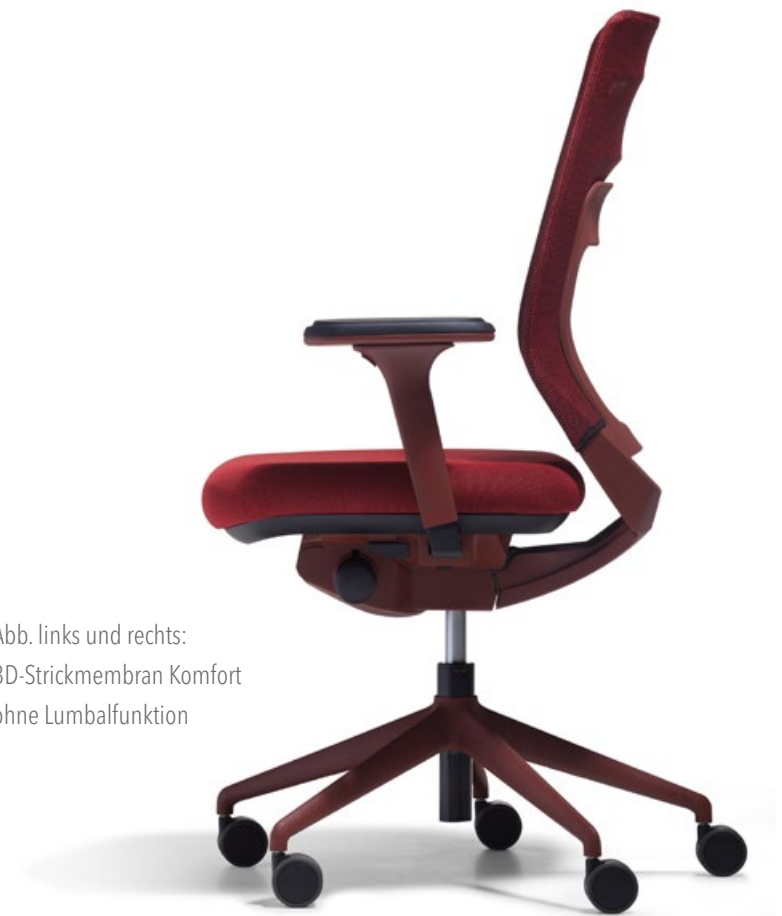
Abb. links und rechts: 3D-Strickmembran Komfort ohne Lumbalfunktion

Der fm asiento ist nicht irgendein Bürostuhl. Der fm asiento ist ein Unikat – einzigartig und unverwechselbar. Ein Stuhl mit einem fm-eigenen Look, einem modernen Farbkonzept und einem einzigartigen Materialmix. Der fm asiento ist komplett über fm entwickelt und wird mit eigenen Werkzeugen in Deutschland produziert.