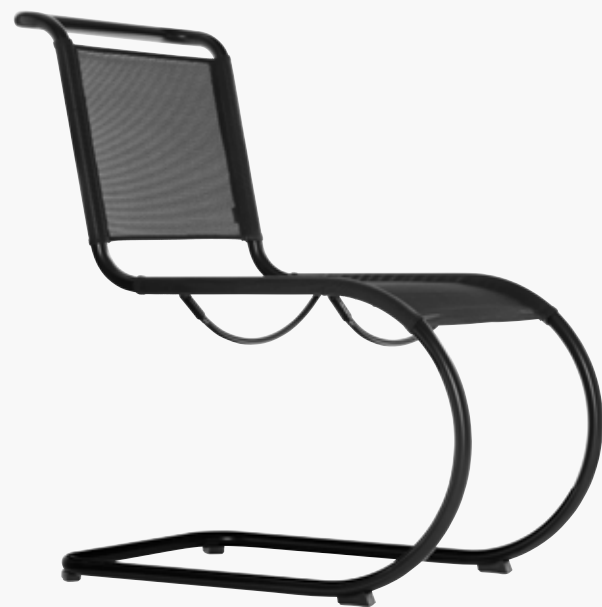
S 533 N OUTDOOR

EN With our outdoor-collection for indoor and outdoor use we give our tubular steel classics the opportunity to present themselves in any weather. Selected icons from the Bauhaus era, including chairs S 33 and S 34 by Mart Stam, the side table B 9 and the lounge chair S 35 by Marcel Breuer and the cantilever chair S 533 by Ludwig Mies van der Rohe have received a makeover and are now weather-resistant and beautiful companions outdoors as well thanks to a special technology. In the sun or rain, on the terrace or balcony, in the winter garden or dining room – our collection is a real eye-catcher in any season.