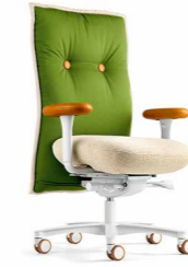
BRASILIAN CHAIR KN 98