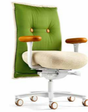
BRASILIAN CHAIR KN 97