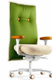
BRASILIAN CHAIR KN 99