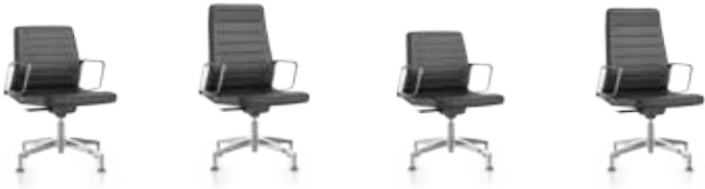
Konferenz- sessel nieder, Schale sichtbar, Sitz und Rücken gepolstert Konferenz- sessel nieder, Schale bezogen, Sitz und Rücken gepolstert Konferenz- sessel hoch, Schale sichtbar, Sitz und Rücken gepolstert Konferenz- sessel hoch, Schale bezogen, Sitz und Rücken gepolstert 1V10 1V11 1V60 1V61