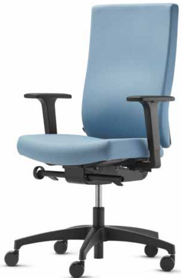
SE AJ 4846 + Armlehnen | Armrests A246KGS