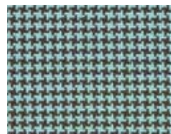
167.016 Wassergrün Ice green