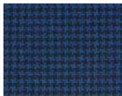
167.028 Marineblau Navy blue