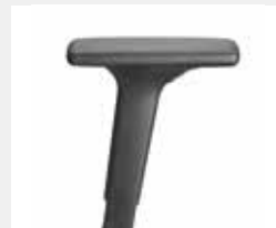
A341KGS / A348KGS* (3F) Armauflagen PU soft Armpads PU soft