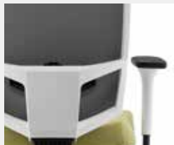
KVW Verkehrsweiß (~RAL 9016) Traffic white (~RAL 9016)