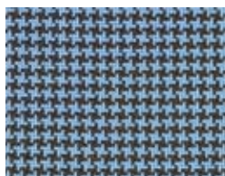
167.120 Hellblau Light blue