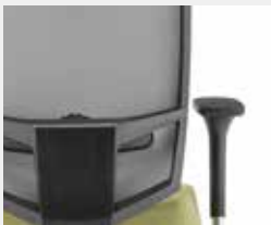
KGS Schwarz (RAL 9011) Black (RAL 9011)