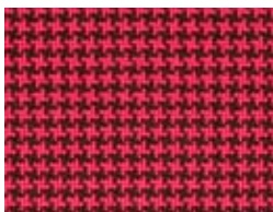
167.140 Koralle Coral