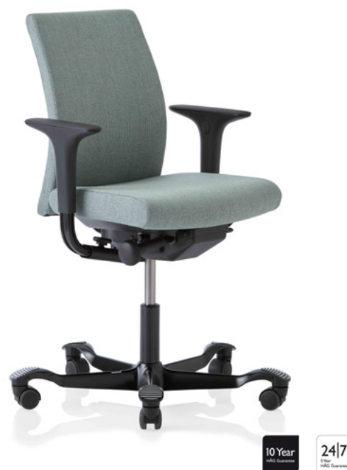
Design: Peter Opsvik. Patent- und Designgeschützt.