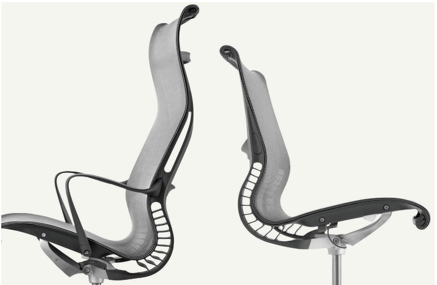
Die Vielseitigkeit des Kinematic Spine ermöglicht noch mehr verschiedene Haltungen beim Sitzen. Beim Setu Lounge-Stuhl können Sie die ideale Position beim Zurücklehnen finden, ohne etwas verstellen zu müssen.