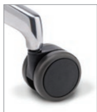
für harte Böden