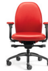
TANGO TG 23