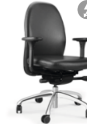
TANGO TG 23 ESDS