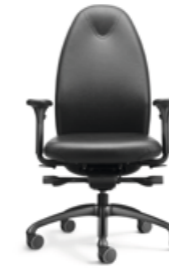
TANGO TG 24