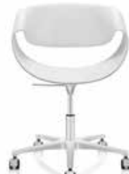
Höhenverstellbar mit Rollen Height-adjustable with castors