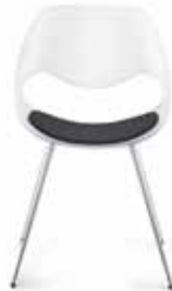
Mit Sitzpolster With seat cushion