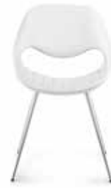
Komplett Leder oder Stoff Full leather or fabric