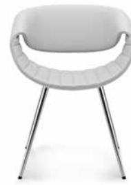
Komplett Leder oder Stoff Full leather or fabric