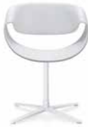
Fusskreuz Cross base