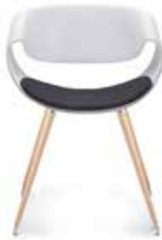
Mit Sitzpolster With seat cushion