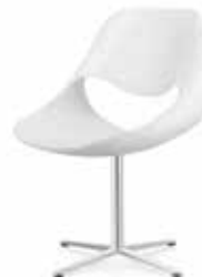
Fusskreuz Cross base