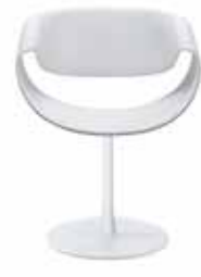
Tellerfuss Circular base