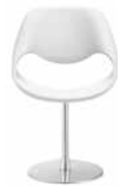
Tellerfuss Circular base