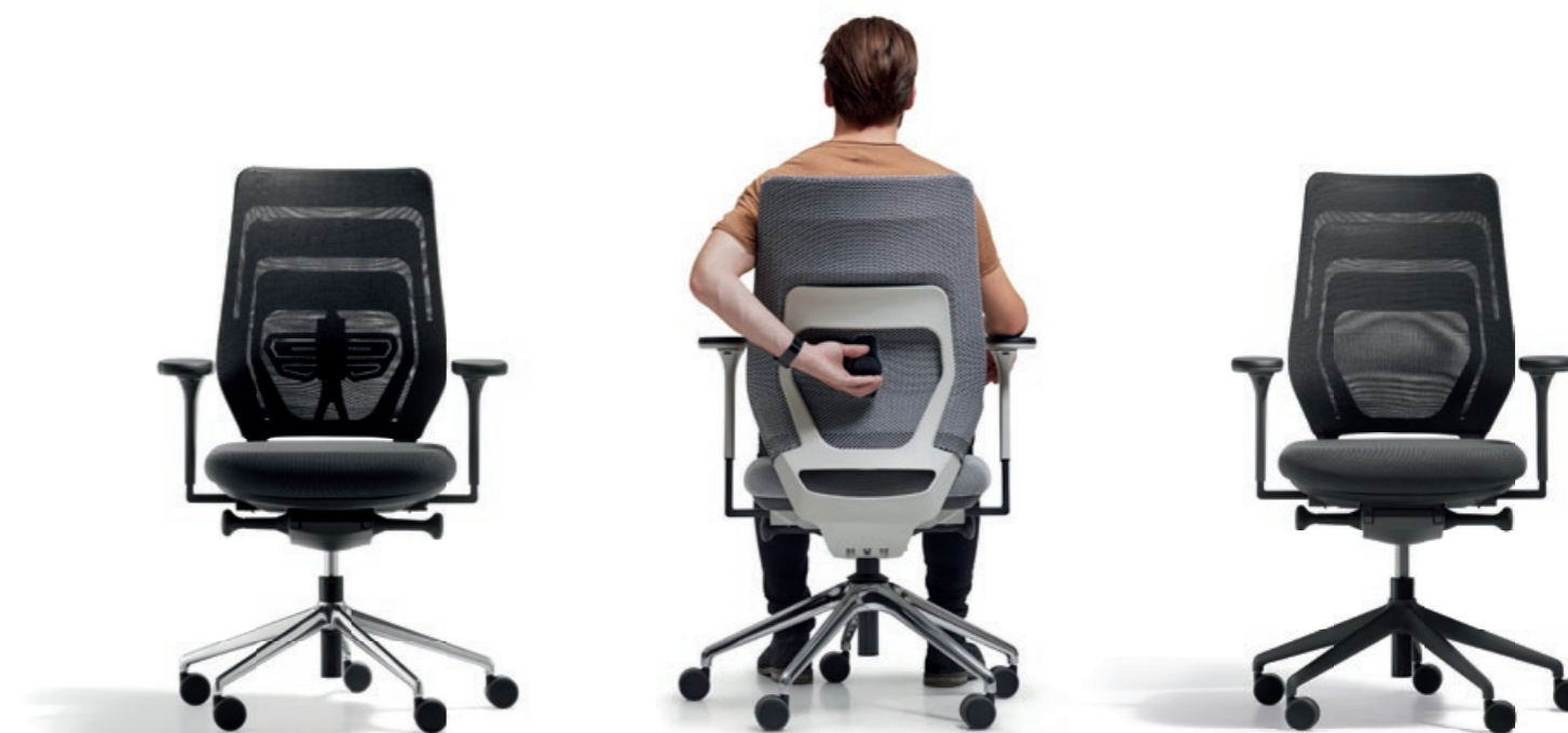
Rückenlehne mit Lumbalfunktion

Optional kann die Rückenlehne mit einer adaptiven Lumbalfunktion ausgestattet werden. Die Lumbaleinstellung ist 70 mm in der Höhe und 25 mm in der Tiefe justierbar. Der Nutzer kann beim Sitzen die für ihn optimale Position bequem einstellen.