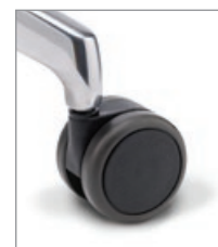
für harte Böden