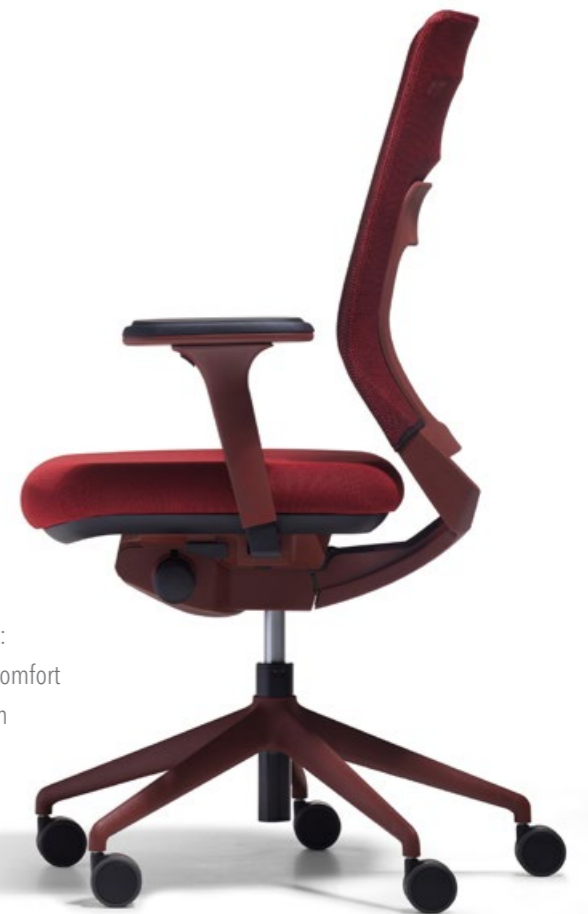
Abb. links und rechts: 3D-Strickmembran Komfort ohne Lumbalfunktion

Der fm asiento ist nicht irgendein Bürostuhl. Der fm asiento ist ein Unikat – einzigartig und unverwechselbar. Ein Stuhl mit einem fm-eigenen Look, einem modernen Farbkonzept und einem einzigartigen Materialmix. Der fm asiento ist komplett über fm entwickelt und wird mit eigenen Werkzeugen in Deutschland produziert.