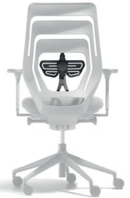
Farbe Schwarz Höhenverstellung 70 mm Tiefenverstellung 25 mm