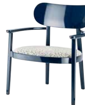
119 SPF SITZ GEPOLSTERT/ UPHOLSTERED SEAT