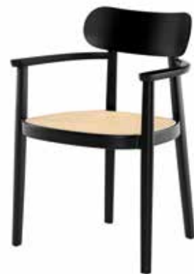
118 FV ROHRGEFLECHT/ CANEWORK