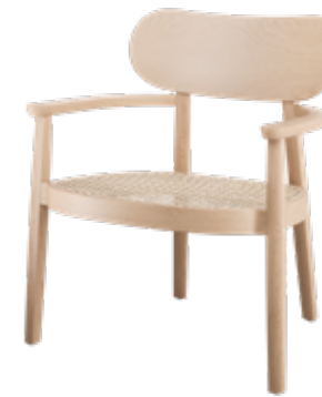
119 F ROHRGEFLECHT/ CANEWORK