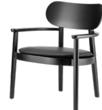
119 MF UND 119 PA MULDENSITZ MIT SITZKISSEN/ MOULDED PLYWOOD SEAT WITH SEAT CUSHION