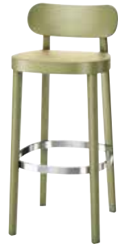
118 H ROHRGEFLECHT/ CANEWORK