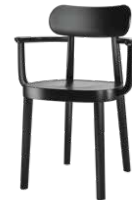
118 MF MULDENSITZ/ MOULDED PLYWOOD SEAT