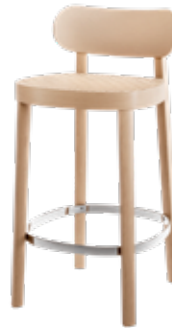
S 118 HT ROHRGEFLECHT/ CANEWORK