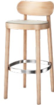
118 SPH SITZ GEPOLSTERT/ SEAT UPHOLSTERED