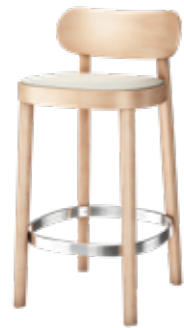
118 SPHT SITZ GEPOLSTERT/ SEAT UPHOLSTERED