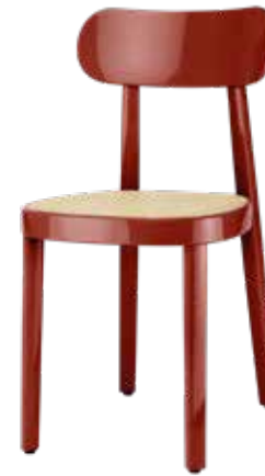
118 ROHRGEFLECHT/ CANEWORK