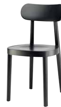
118 M MULDENSITZ/ MOULDED PLYWOOD SEAT