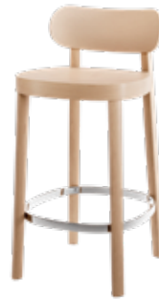
118 MHT MULDENSITZ/ MOULDED PLYWOOD SEAT