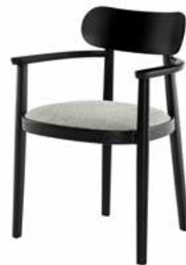
118 SPFV SITZ GEPOLSTERT/ SEAT UPHOLSTERED