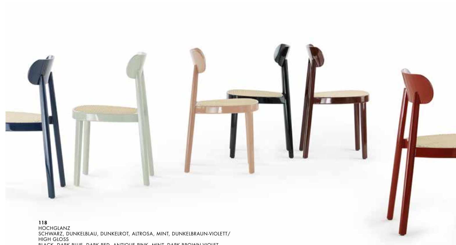
118 HOCHGLANZ SCHWARZ, DUNKELBLAU, DUNKELROT, ALTROSA, MINT, DUNKELBRAUN-VIOLETT/ HIGH GLOSS BLACK, DARK BLUE, DARK RED, ANTIQUE PINK, MINT, DARK BROWN-VIOLET

The bent seat frame and the hand crafted seat covered with canework refer to the original archetype of a Thonet chair, no. 214. The chair 118 is optionally available with a moulded seat or seat upholstered.