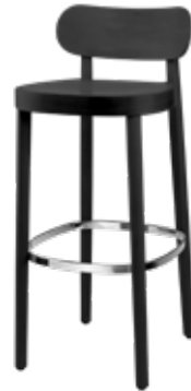
118 MH MULDENSITZ/ MOULDED PLYWOOD SEAT