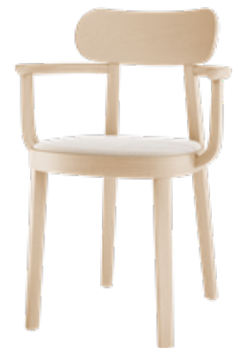
118 SPF SITZ GEPOLSTERT/ SEAT UPHOLSTERED