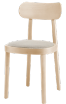
118 SP SITZ GEPOLSTERT/ SEAT UPHOLSTERED