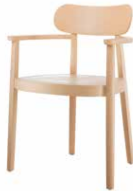
118 MFV MULDENSITZ/ MOULDED PLYWOOD SEAT