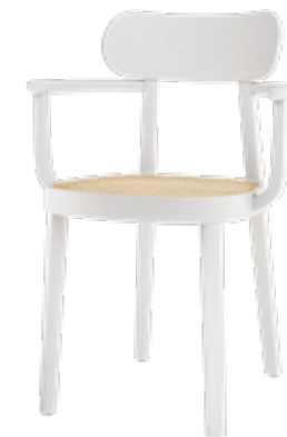
118 F ROHRGEFLECHT/ CANEWORK