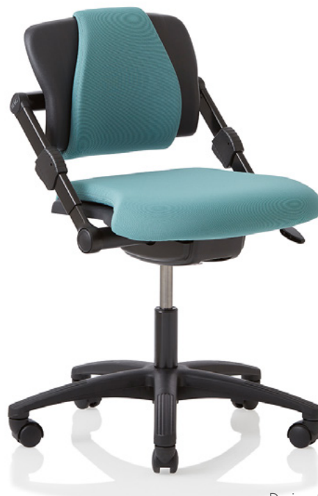
Design: Søren Yran Patent- und Designgeschützt.