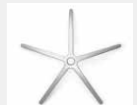
FHAPO Aluminium poliert (Option) Aluminium polished (option)

*mit antibakterieller Mikrosilberausrüstung zum Schutz vor Infektionen with antibacterial microsilver finish to help prevent infections