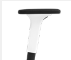
A341KGS* (3F) Armauflagen PU soft Armpads PU soft