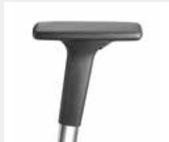
A441APO* (4F) Armauflagen PU soft Armpads PU soft