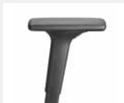
A441KGS (4F) Armauflagen PU soft Armpads PU soft