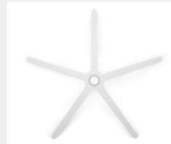
FHKVW Kunststoff weiß (Option) White plastic (option)