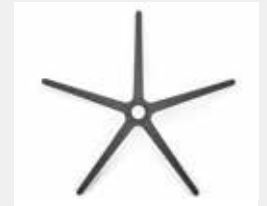
FHKGS Kunststoff schwarz (Standard) Black plastic (standard)