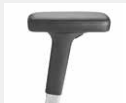
A442APO (4F) Leder-Armauflagen Leather armpads