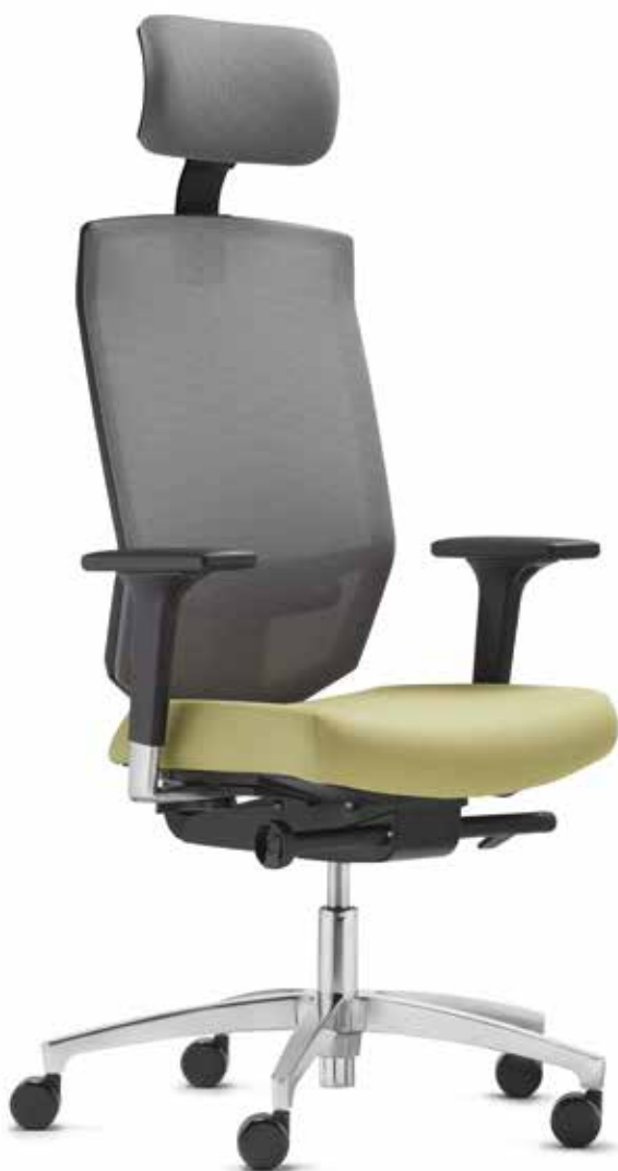
SE AJ 5786 mesh + Armlehnen | Armrests A441APO Netz | Mesh Web M Platingrau | Platin

The distinctive mesh backrest catches the eye instantly. It allows an active yet relaxed seated posture and provides optimum breathability. The optional Ergo neckrest offers even more seating comfort, is height-adjustable and tiltable.