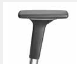
A541APO (5F) Armauflagen PU soft Armpads PU soft