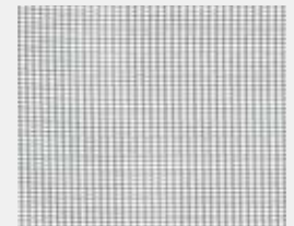
Web S (100% Polyester) Schwarz | Black (Standard)