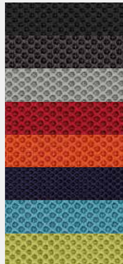
Web M (100% Polyester) Abstandsgewebe (3 mm) in 8 Farben (Option) Spacer fabric (3 mm) in 8 colours (option)