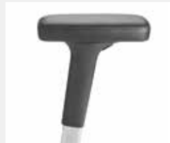
A442APO* (4F) Leder-Armauflagen Leather armpads

* Farbe der Armlehnenhülse = Modellfarbe Colour of armrest cover = model colour