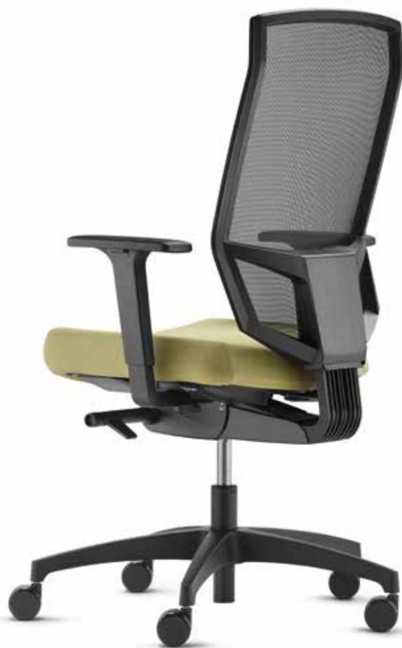
SE AJ 5776 mesh + Armlehnen | Armrests A246KGS Netz | Mesh Web S schwarz | Midnight black