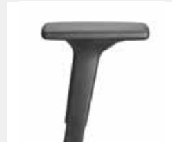
A341KGS / A348KGS* (3F) Armauflagen PU soft Armpads PU soft