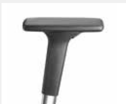
A341APO / A441APO (3F/4F) Armauflagen PU soft Armpads PU soft