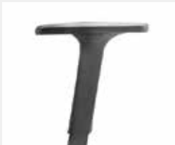
A246KGS (2F) Armauflagen PU soft Armpads PU soft