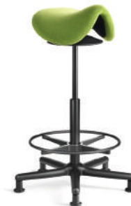
SEDLO SL 3-5 XL E