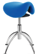
SEDLO SL 2-5 V