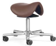
SEDLO SL 2-5 E