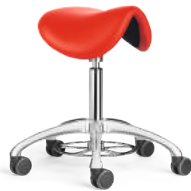
SEDLO SL 2-5 A + 1F1