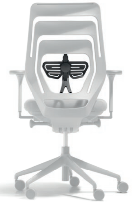
Farbe Schwarz Höhenverstellung 70 mm Tiefenverstellung 25 mm