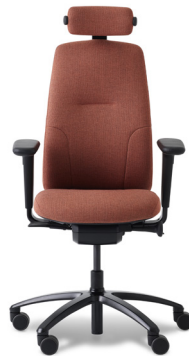
9212 RH LOGIC 220