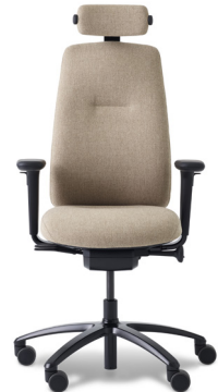
9219 RH LOGIC 220 ELITE