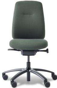
9119 RH LOGIC 200 ELITE