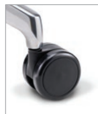
für weiche Böden