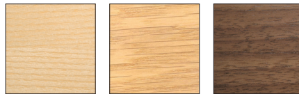
Esche / Ash