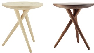
Esche / Ash