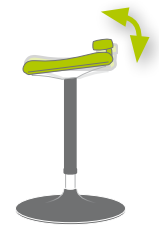
Sitzneigungsverstellung (Mod. 9452, 9454, 9456)