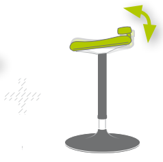
Sitzneigungsverstellung (Mod. 9452, 9454, 9456)