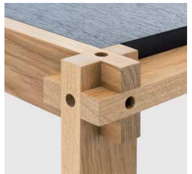
Verzapfte Rahmen Dovetailed Frames Cadre tenon-mortaise