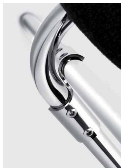
Blaser-Verbinder Blaser fastener Raccord Blaser