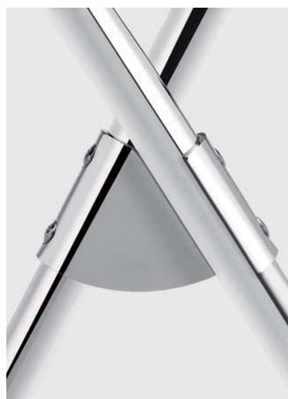
Blaser-Verbinder Blaser fastener Raccord Blaser