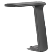
Fixe T-Armlehne, schwarz