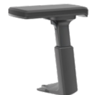
3D T-Armlehne, schwarz