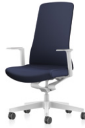
Drehstuhl, Rücken gepolstert

PURE IS3 passt perfekt in jedes Umfeld. Sein klares Design und die große Auswahl an Farben und Stoffen lassen viel Freiheit für eine individuelle Gestaltung. Die Kollektion umfasst vier Drehstuhlmodelle: Netz- und Polsterrücken, jeweils in weißem und schwarzem Design. Dabei kann aus einer Vielzahl an Materialien und Farben ausgewählt werden. Smart Spring, Stuhlsäule und die optionalen Armlehnen sind bei allen Modellen einheitlich entweder in Weiß oder Schwarz gehalten. Zur Auswahl stehen fixe T-Armlehnen oder 3D T-Armlehnen, die fixe T-Armlehne besticht durch ihr schlankes Design, die 3D T-Armlehne überzeugt zudem funktionell und ist in Höhe, Breite und Tiefe verstellbar.