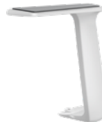
Fixe T-Armlehne, weiß