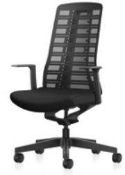
Drehstuhl, Rücken netzbespannt