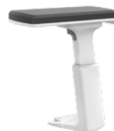
3D T-Armlehne, weiß