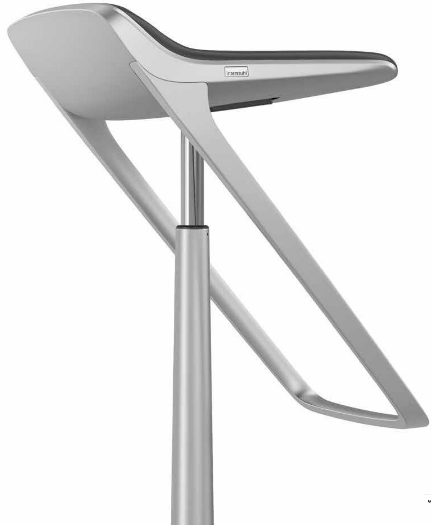
Barhocker ohne Fußraste, Integrierte Höhenverstellung mittels Griffmulde

Wertvolle Materialien prägen die Ausstrahlung von KINETIC SS . Er spielt mit Haptik und Farbe. So sind die Metallteile in schwarz, brillantsilber, weiß oder auch in fühlbar edlem gestrahltem Aluminium ausgeführt.