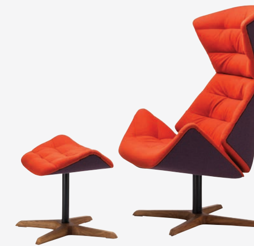
808 H UND 808 GESTELL NUSSBAUM GEÖLT, POLSTERUNG/ FRAME WALNUT OILED, UPHOLSTERY