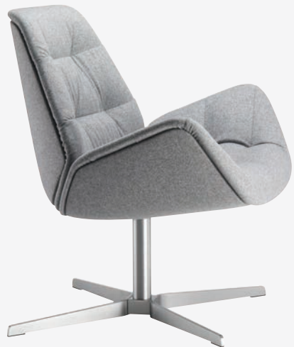
809 GESTELL FLACHSTAHL EDELSTAHOPTIK POLSTERUNG/ FRAME FLAT STEEL STAINLESS STEEL DESIGN, UPHOLSTERY