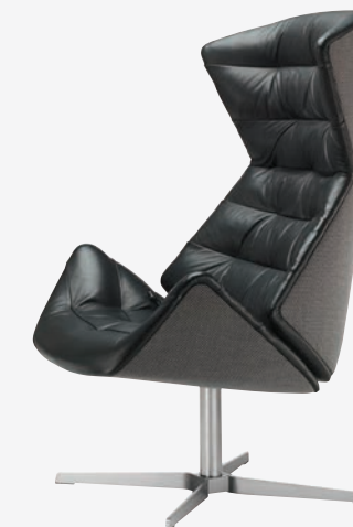
808 GESTELL FLACHSTAHL EDELSTAHOPTIK, POLSTERUNG/ FRAME FLAT STEEL STAINLESS STEEL DESIGN, UPHOLSTERY