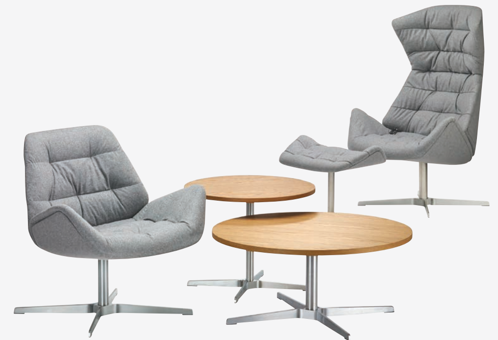
809, 1809 1808 UND/AND 808 GESTELLE FLACHSTAHL EDELSTAHL OPTIK, POLSTERUNG, PLATTEN EICHE KLAR LACKIERT/ FRAMES FLAT STEEL STAINLESS STEEL DESIGN, UPHOLSTERY, TABLETOPS OAK CLEAR LACQUERED

The compact lounge chair 809 functions as a “small brother” of the successful lounge chair 808, and as a place of retreat in smaller rooms or in groups, and in combination with the larger chair or the low side tables 1808 and 1809. A footstool rounds off the range.