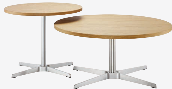
1808 TISCH NIEDRIG 1809 TISCH HOCH GESTELLE FLACHSTAHL EDELSTAHOPTIK PLATTEN EICHE KLAR LACKIERT/ FRAMES FLAT STEEL STAINLESS STEEL DESIGN, TABLETOPS OAK CLEAR LACQUERED