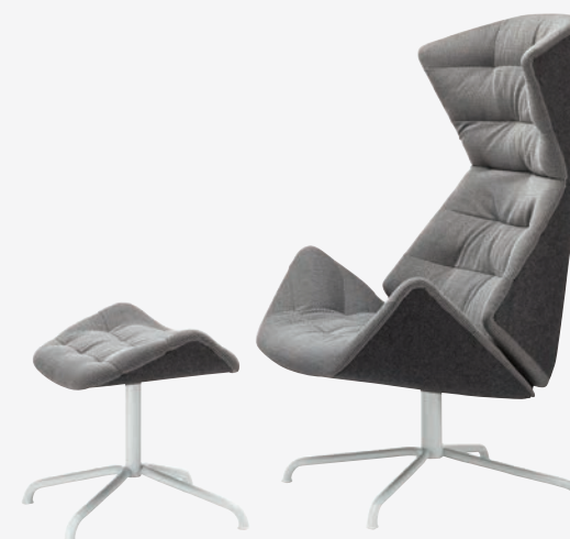
808 H UND 808 STAHLROHRGESTELL, POLSTERUNG/ TUBULAR STEEL FRAME, UPHOLSTERY