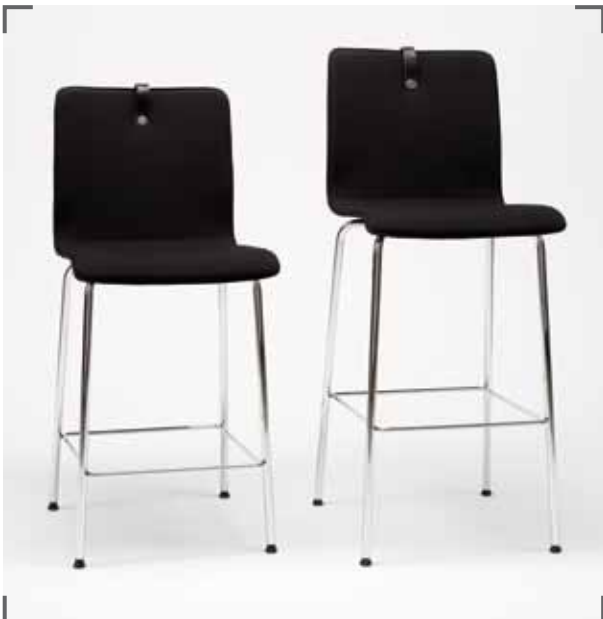
Barstuhl MESAMI 2 MM40, Barstuhl MESAMI 2 MM50 barchair MESAMI 2 MM40, barchair MESAMI 2 MM50 chaise de bar MESAMI 2 MM40, chaise de bar MESAMI 2 MM50