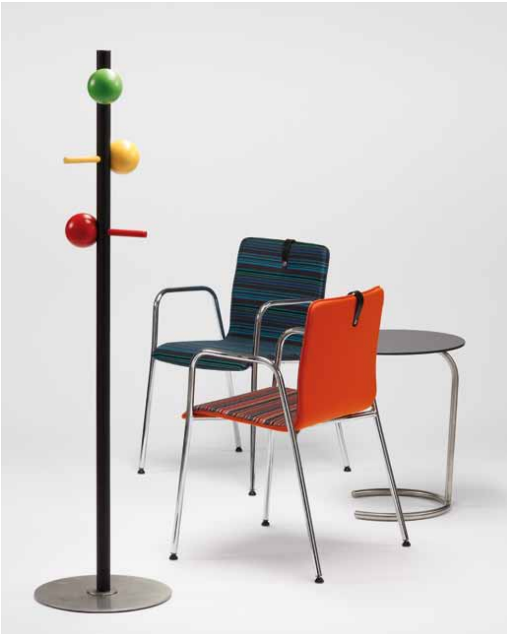
Garderobe HOLZER, Besucherstuhl MESAMI 2 MM11, Sattztisch HOLZER coatrack HOLZER, chair for visitirs MESAMI 2 MM11, gueridon HOLZER Portemanteau HOLZER, chaise visiteur MESAMI 2 MM11, table gigogne HOLZER