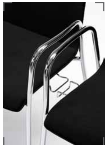
Reihenverbindung MESAMI 2 MM11 connection for row seating MESAMI 2 MM11 connexion chaise visiteur MESAMI 2 MM11