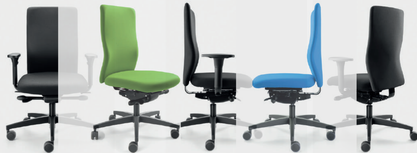
Schwarzer Stoff: B 904 Tripolis / grüner Stoff: B 936 Lingen / blauer Stoff: B 938 Murnau

CYMO verbindet Wirtschaftlichkeit mit ergonomischen Qualitäten. Ein Bürodrehstuhl mit klarer Form und bewährter ERGO TOP-Technologie. LÖFFLER Qualität im ausgewogenen Preis-Leistungs-Verhältnis. CYMO , der verlässliche Begleiter im Arbeitsalltag.