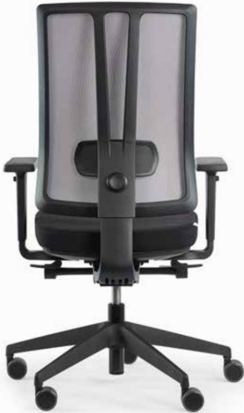
MODELL ceto novo CN25GH1L2