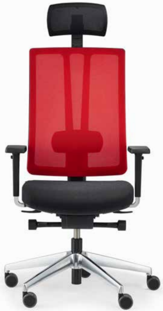
MODELL ceto novo CN95HQ1L4