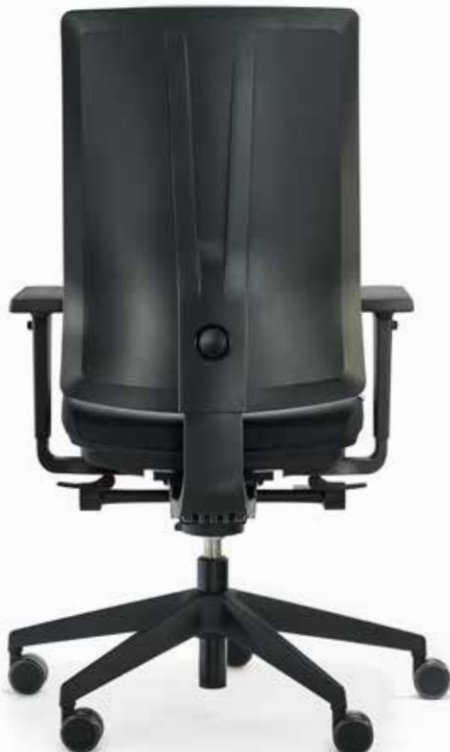
MODELL ceto novo CN23IH1L2