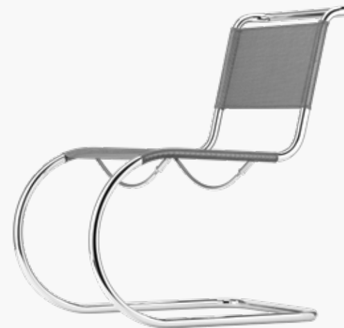
S 533 N NETZGEWEBE/ SYNTHETIC MESH