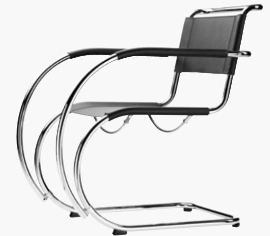
S 533 LF MIT ARMLEHNEN, KERNLEDER NATURBELASSEN/ WITH ARMRESTS, FULL GRAIN BUTT LEATHER