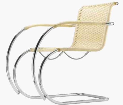
S 533 RF MIT ARMLEHNEN, KORBGEFLECHT/ WITH ARMRESTS, WICKERWORK