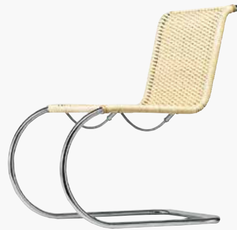
S 533 R KORBGEFLECHT/ WICKERWORK