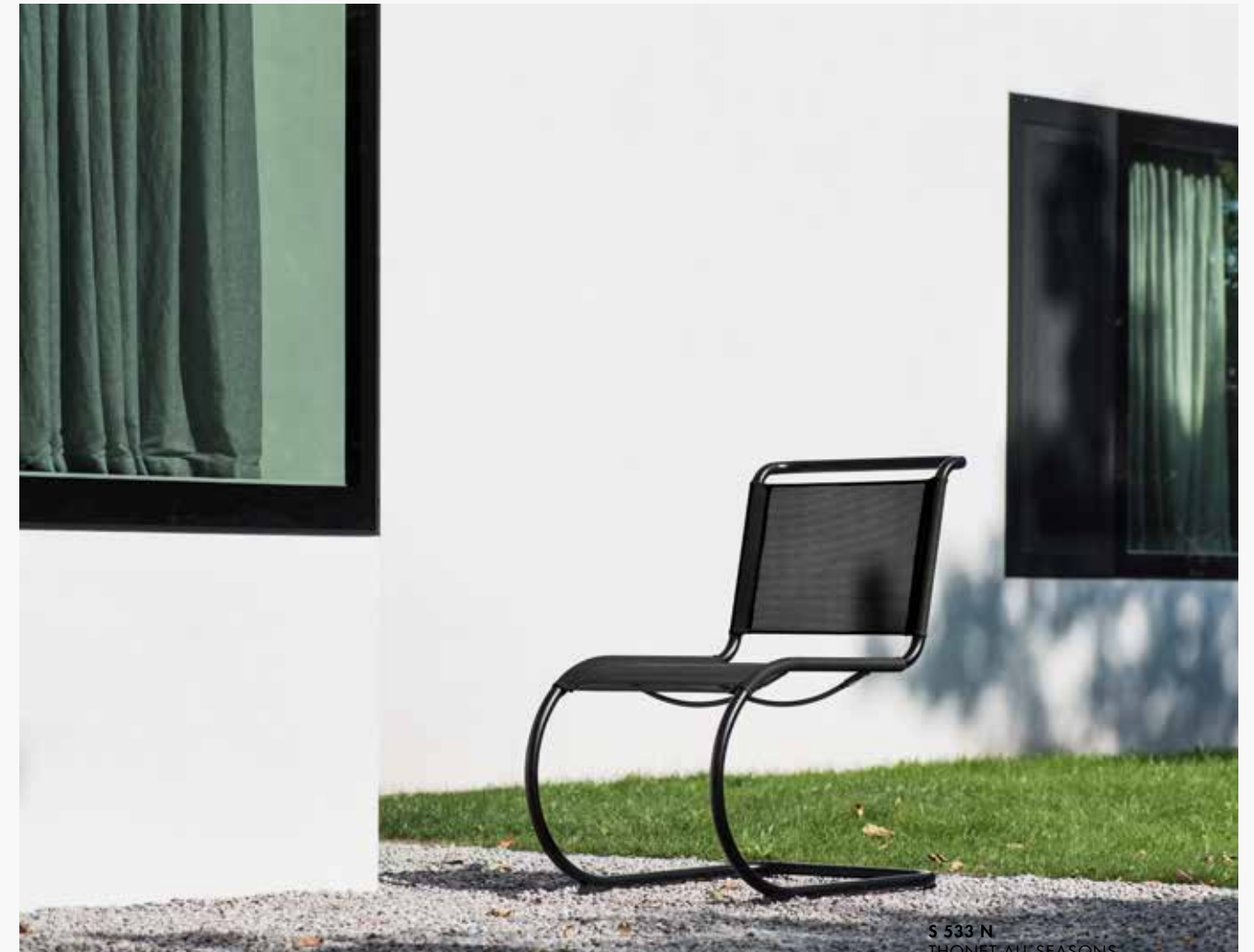
S 533 N THONET ALL SEASONS