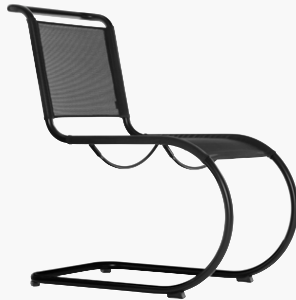
S 533 N OUTDOOR

We have compiled various materials for your personal outdoor model. The seat and backrest are made of resilient mesh, and the seat mesh can be retightened if needed with stretching brackets underneath. For even more comfort, we also offer fitting cushions. Armrests in various materials round off the model's overall appearance. The ThonetProtect® coating makes our frames robust and durable under all weather conditions.