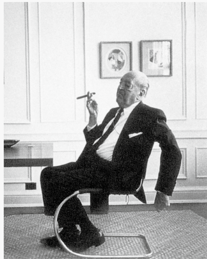
LUDWIG MIES VAN DER ROHE

EN Ludwig Mies van der Rohe, born in 1886 in Aachen, joined Peter Behrens' architectural office at the age of 22; there he met Walter Gropius and Le Corbusier. Soon, Mies van der Rohe became a protagonist of the new glass and steel architecture of the time. His design for a glass and steel high-rise building at Bahnhof Friedrichstrasse in Berlin was decisive. He was responsible for the artistic direction of Deutscher Werkbund starting in 1925. In 1927, the Weissenhof Estate in Stuttgart was created under his direction. In 1930, Walter Gropius appointed Mies van der Rohe to the position of director of the Bauhaus; on August 10, 1933 he had to close it under pressure from the NSDAP. He afterwards emigrated to the United States. In 1938 he went to Chicago, where he took over the direction of the architecture department at the Armour Institute. He became one of the most influential architects in the world. His steel skeleton buildings with large-scale glass curtain walls such as the Seagram Building in New York (1958) or the National Gallery in Berlin (1968) are among the highlights of modern architecture. His furniture designs usually evolved in connection with his buildings. Ludwig Mies van der Rohe died in 1969 in Chicago.