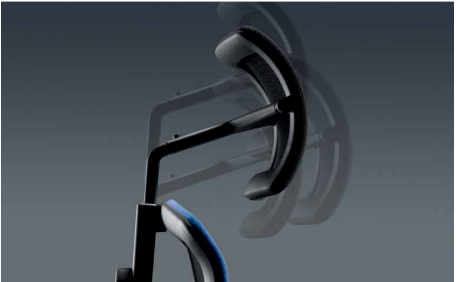
Die Kopfstütze ist in der Höhe, Tiefe und Neigung verstellbar.