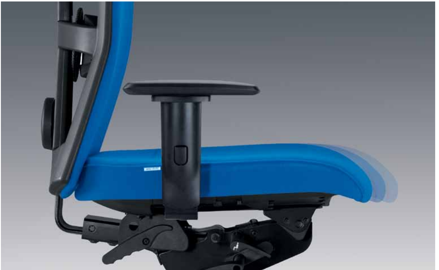
Die Sitztiefenverstellung ermöglicht eine individuelle Einstellung auf die Oberschenkelänge.