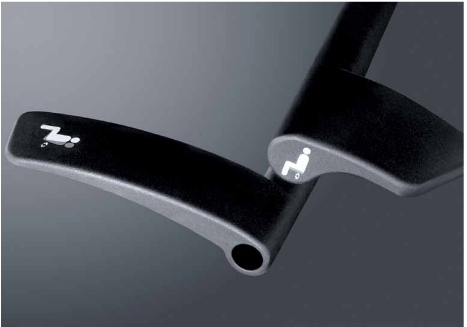
Intuitive Bedienhebel zur Einstellung auf das Körpergewicht, großes Spektrum von 45 kg –130 kg.