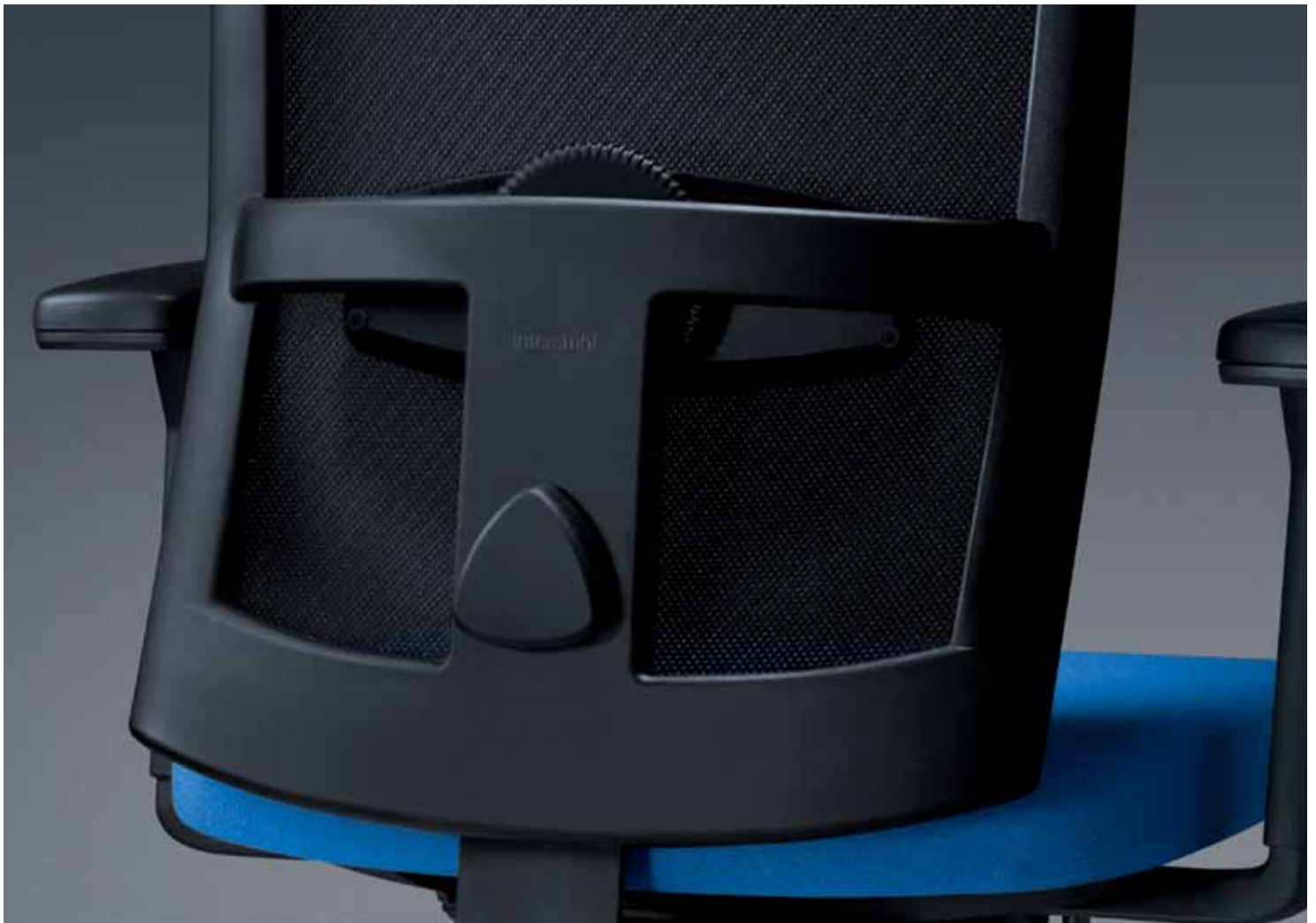
Formschön gestaltete und geschwungene Rückenlehne, Verarbeitung mit Detailliebe.