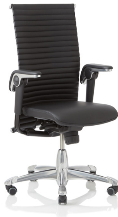
Design: Svein Asbjørnsen/sapDesign@. Patent- und Designgeschützt.