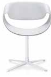
Fusskreuz Cross base