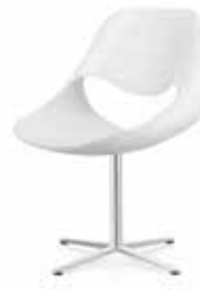
Fusskreuz Cross base