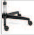
Stahl schwarz Black steel Code 39