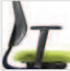
4F-Armlehnen (PU soft) 4F armrests (PU soft) Nr. / No. 146

Atmungsaktive Kunststoff-Membran Breathable plastic membrane höhenverstellbare Rückenlehne (8 cm, Easy-Touch-System) height-adjustable backrest (8 cm, Easy-Touch-System)