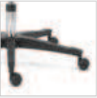
Kunststoff schwarz Black plastic Code 35