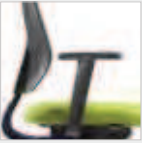
2F-Armlehnen (PU soft) 2F armrests (PU soft) Nr. / No. 143