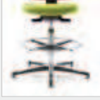
Mit Fußring With foot ring IS 21198: 57-82 cm