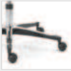
Aluminium poliert Polished aluminium Code 25